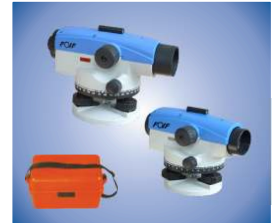
Nivel AL100 con estuche de transporte

* Dependiendo de la mira de nivelación y metodología de trabajo empleado